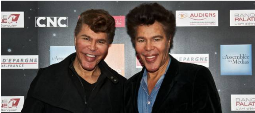
Les frères Bogdanov ont gagné lundi leur procès en diffamation contre l'hebdomadaire "Marianne".

Les célèbres jumeaux ont gagné lundi leur procès en diffamation contre l'hebdomadaire qui a publié plusieurs articles au vitriol les visant fin 2010.